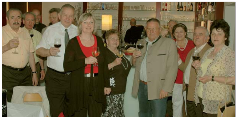
Die Pensionisten laden am Sonntag, dem 11. April, zum Kränzchen ein und zwar ab 14 Uhr ins Gasthaus Hagenauer in Buchschachen.